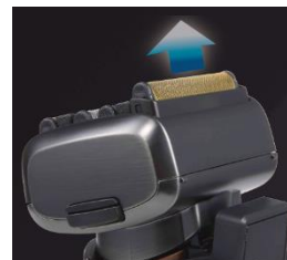
ナローシェーブモード