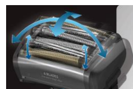
6 枚密着ピタヘッド

ヘッド部が前後 20°、左右 13°、刃が独立して上下 3mm 可動します。ヘッド部の前後左右の動きに加え、外刃と内刃の一体構造の複数サスペンションにより、刃が上下に浮き沈みし、肌にやわらかく、ピタッと密着します。