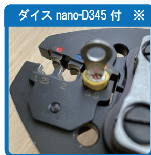
ダイス nano-D345 付 ※